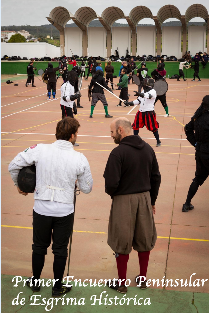
Primer Encuentro Peninsular de Esgrima Histórica