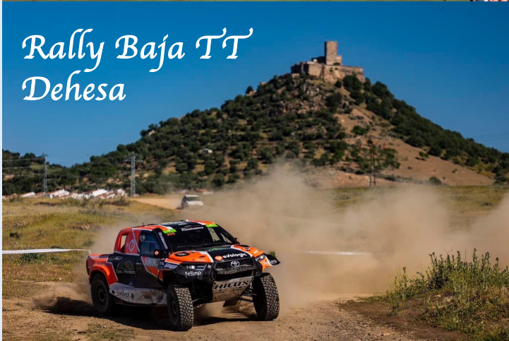
Rally Baja TT Dehesa