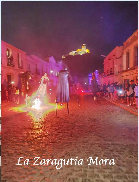
La Zaragutía Mora