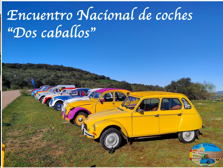
Encuentro Nacional de coches "Dos caballos"