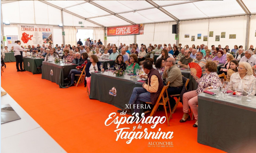
XI FERIA del Espárrago y la Tagarnina ALCONCHEL