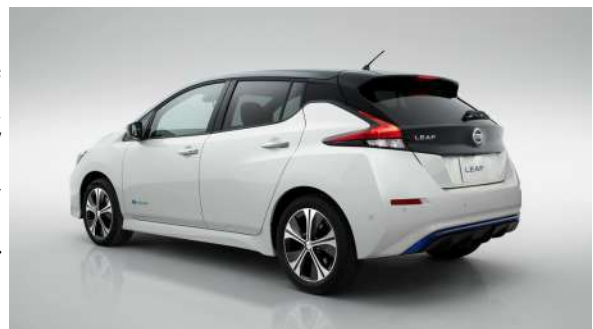
Nuevo coche eléctrico para la Policía Local de Alconchel

Con el objetivo de que la convivencia entre los vecinos y vecinas de nuestro pueblo sea la mejor posible y se garantice la seguridad en los espacios y en el mobiliario públicos QUE UTILIZAMOS TODOS/AS, se ha aprobado una nueva ordenanza que regula infracciones, comportamientos en deberes y derechos para que todos los tengamos claro. Se puede consultar íntegra en la web del Ayuntamiento o a través de “Alconchel Informa” en el bandomóvil.