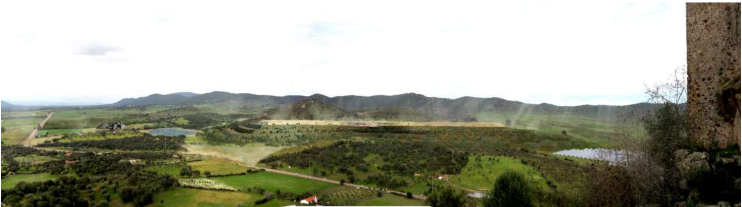
Ilustración 3: vista desde el Castillo durante la actividad minera