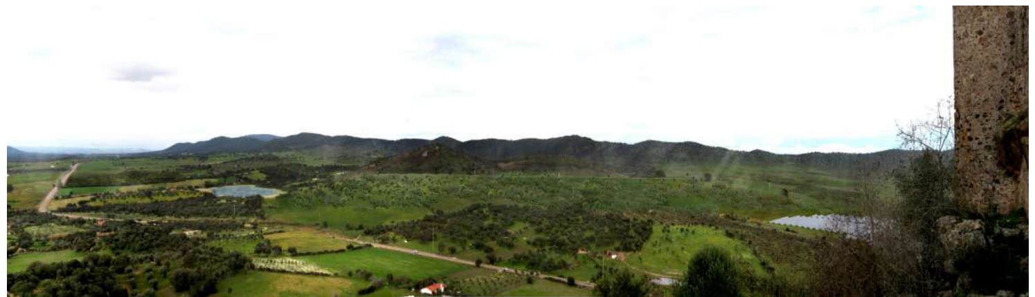
Ilustración 4: vista desde el Castillo de Alconchel cerrada la mina