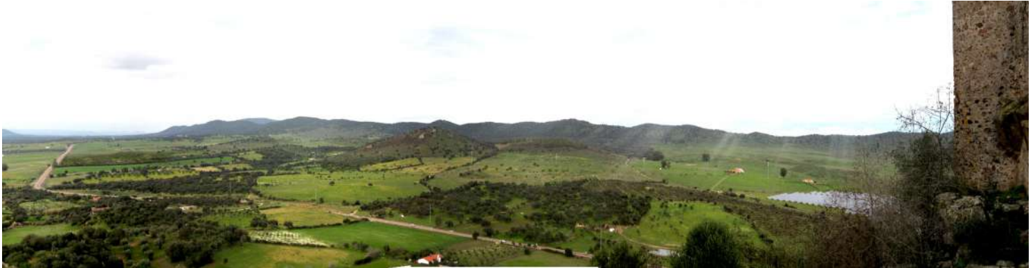
Ilustración 2: vista actual desde el Castillo